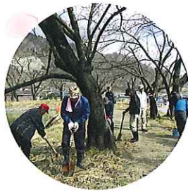
市民参加の施肥作業 2