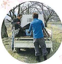
市民参加の施肥作業 1