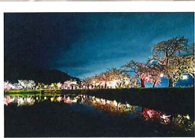
稲荷山桜まつり実行委員会長賞 「色とりどりに輝く」

今年も「治田公園桜写真コンテスト」を開催予定です！ 皆さん、ぜひご応募ください。写真コンテストの詳細に関しては、後日千曲市のホームページにてお知らせします。