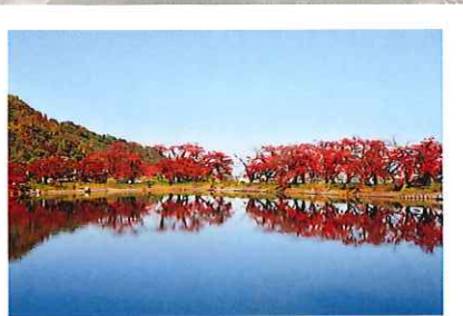
治田公園桜再生プロジェクト実行委員会長賞 「桜葉紅葉」

『治田公園の桜の木のある風景』 四季折々の治田公園の桜の魅力を広くPRできる作品