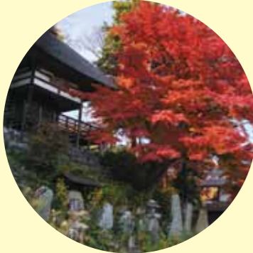
おばすて 観月祭・全国俳句大会 9月16日 長楽寺を中心に中秋の名月にちなんだ俳句大会を開催。