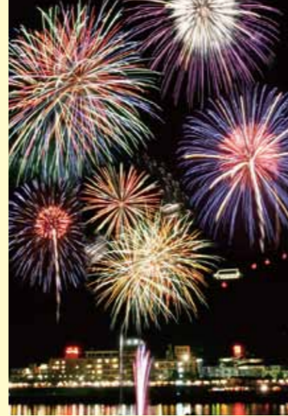
第88回 信州千曲市千曲川納涼煙火大会 8月7日 約1万発の花火が上がる、華麗な夏の祭典。