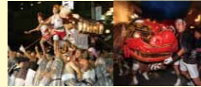
戸倉上山田温泉夏祭り 7月15・16日 いなせな神輿、木遣り、民踊流し、勇獅子、冠着太鼓、フィナーレは煙火大会。