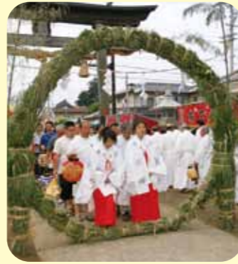
須須岐水神社 茅の輪まつり 7月31日 環状の「茅の輪」をくぐり子供の成長を願う夏のお祭り。