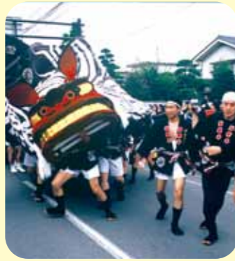
稲荷山祇園祭 7月15・16日 五穀豊穡と繁栄を祈願する治田神社をよりどころとする夏のお祭り。