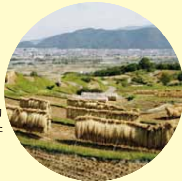
棚田の稲刈り 9月下旬 昔ながらのハゼかけをして刈った稲を天日干しします。