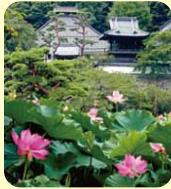
大雲寺 蓮見頃 7月中旬～8月 大雲寺は自然探勝園にも指定されている。