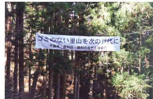
ゴミのない里山を次の世代に