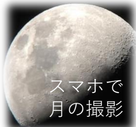
スマホで 月の撮影