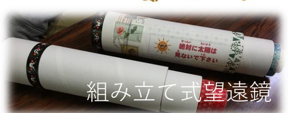
組み立て式望遠鏡