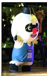
マスコットキャラクター 『ブレア』