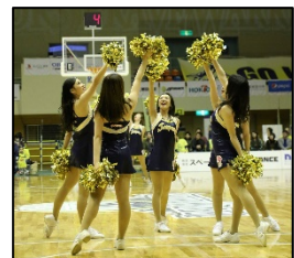
チアダンスチーム 『ジャスパーズ』