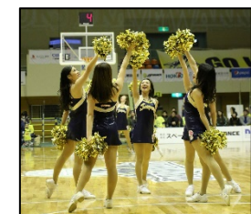
チアダンスチーム 『ジャスパーズ』