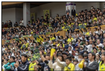
日本一の信州ブスター (ファン)