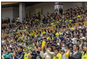
日本一の信州ブスター (ファン)