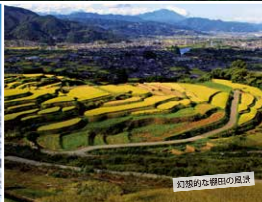
幻想的な棚田の風景