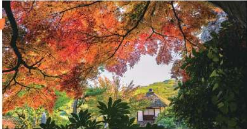
長楽寺 境内には多くの歌碑や句碑があり、門脇の松尾芭蕉の句「おもかげや 嬬(おば)ひとりなく月の友」を刻んだ芭蕉翁面影が著名。 TEL.026-273-3578

お寺や神社の多い千曲市には、秋の風情を楽しめる場所がたくさんあります。紅葉は10月下旬頃からが見頃です。