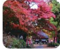
智識寺 真言宗の古刹。本尊の木造十一面観音菩薩立像および大御堂は国の重要文化財。十一面観音拝観は要予約。 TEL.026-275-1120