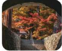
龍洞院 紅葉スポットとして人気。龍洞院架道橋は、明治33年に作られた土木建造物でJR線/井線に跨る官設鉄道(国有鉄道)時代のアーチ橋。 TEL.026-273-1685