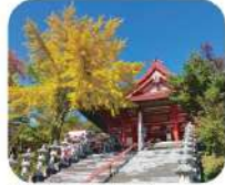
城泉山観音寺 別名「善光寺大本願別院」。御恵観音菩薩と善光寺如来三尊のご分身が祭られている。 TEL.026-275-1757