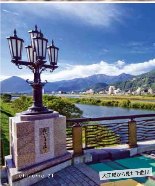
大正橋から見た千曲川

長野県では千曲川、新潟県では信濃川と呼ばれている。全長367kmのうち、千曲川は214km。河川法上では千曲川を含めた信濃川本流を「信濃川」と規定しているため、日本で一番長い川は信濃川となる。川中島古戦場など歴史的場所も多い。