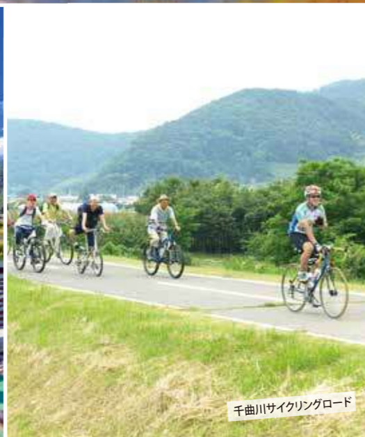
千曲川サイクリングロード